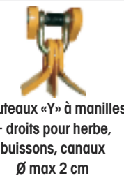
Couteaux «Y» à manilles + droits pour herbe, buissons, canaux Ø max 2 cm