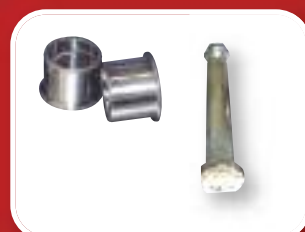
Axes traités montés sur bagues bi-métal épaulées avec graisseurs.