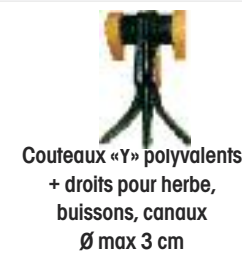
Couteaux «Y» polyvalents + droits pour herbe, buissons, canaux Ø max 3 cm