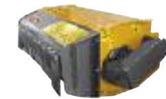
TI 100 Poids : 175 kg