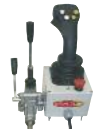
* avec option commande électrique monolevier « ELECTRA »