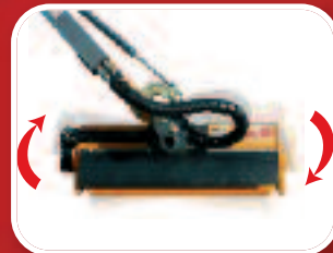
Système floating. Rouleau palpeur réglable 3 positions.