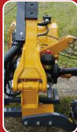
Articulations des bras estampés.