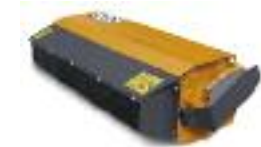
TIM 110 Poids : 133 kg