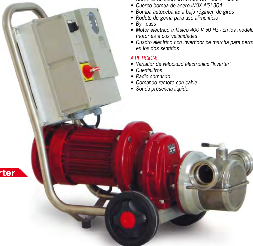
T 60 inverter