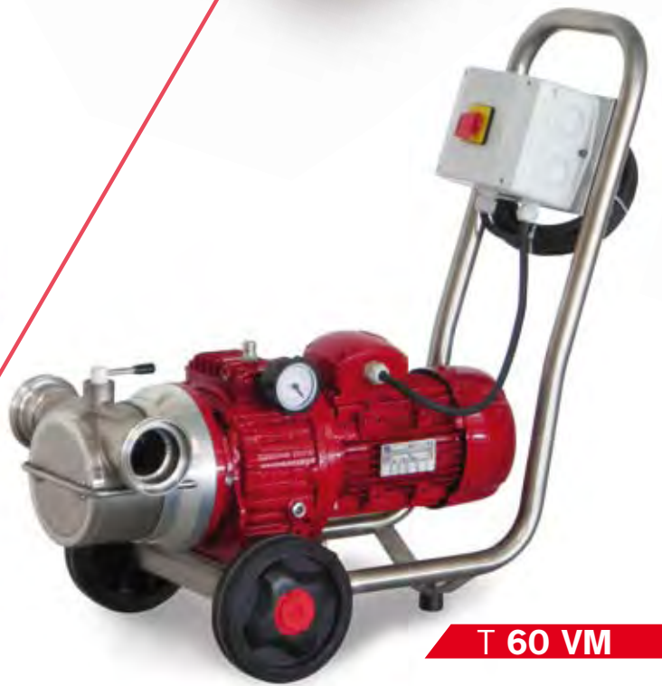
T 60 VM