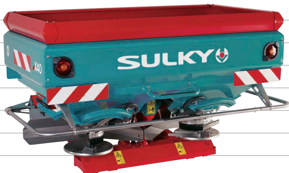
MODÈLE 2 500 I

X40 De 18 à 44 m de largeur de travail (1)