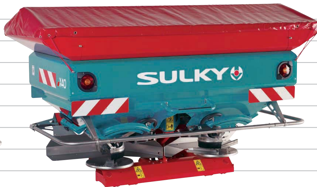
MODÈLE 3 000 I