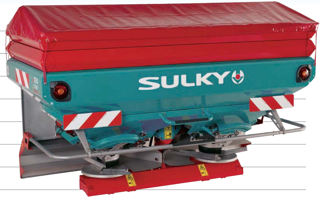
MODÈLE 4 000 I

Charge utile : 4 000 kg 2 400 L • 3 200 L • 4 000 L