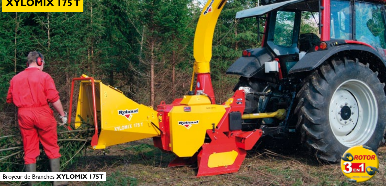
Broyeur de Branches XYLOMIX 175 T

XYLOMIX 100 T XYLOMIX 125 T XYLOMIX 175 T