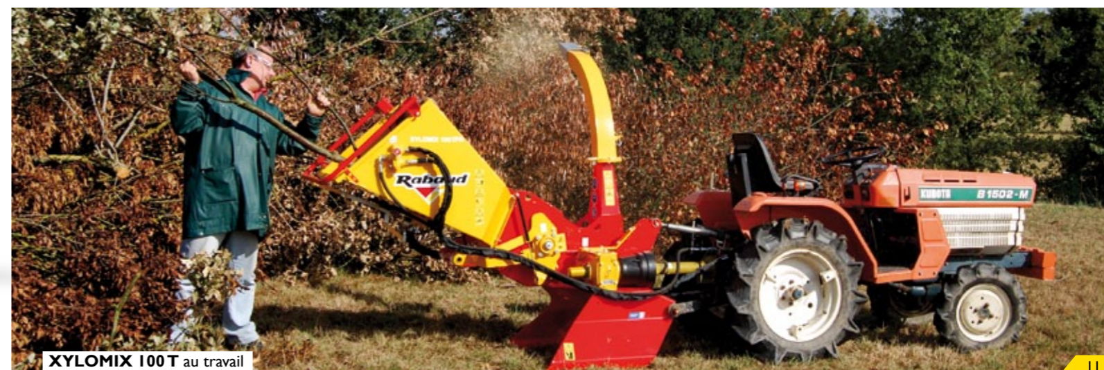
XYLOMIX 100 T au travail