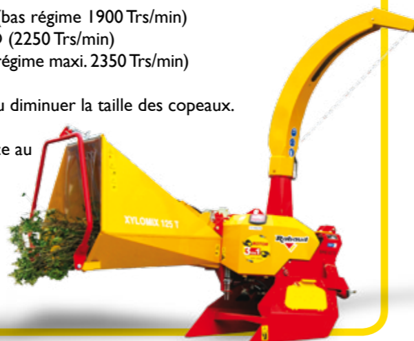
XYLOMIX 125 T

Goulotte orientable sur 360° montée sur couronne à billes (XYLOMIX 125 et 175) avec casquette réglable par chaîne.