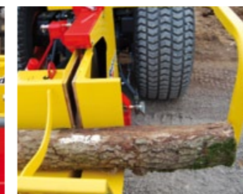
Contrôle de la longueur du bois par butée réglable