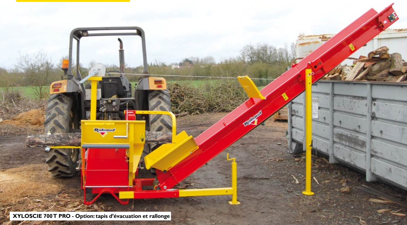
XYLOSCIE 700 T PRO - Option: tapis d'évacuation et rallonge

Versions pour tracteur, idéales pour un usage professionnel.