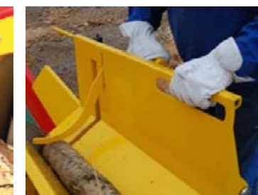
Chevalet ergonomique et sécurisant avec griffe de maintien et poignée.