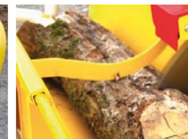
Griffe de maintien poussant le bois au plus près de la lame = pas de course inutile du chevalet