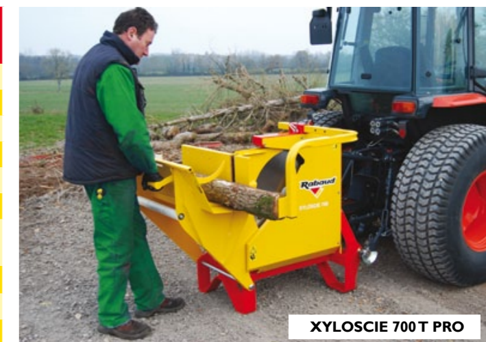
XYLOSCIE 700 T PRO