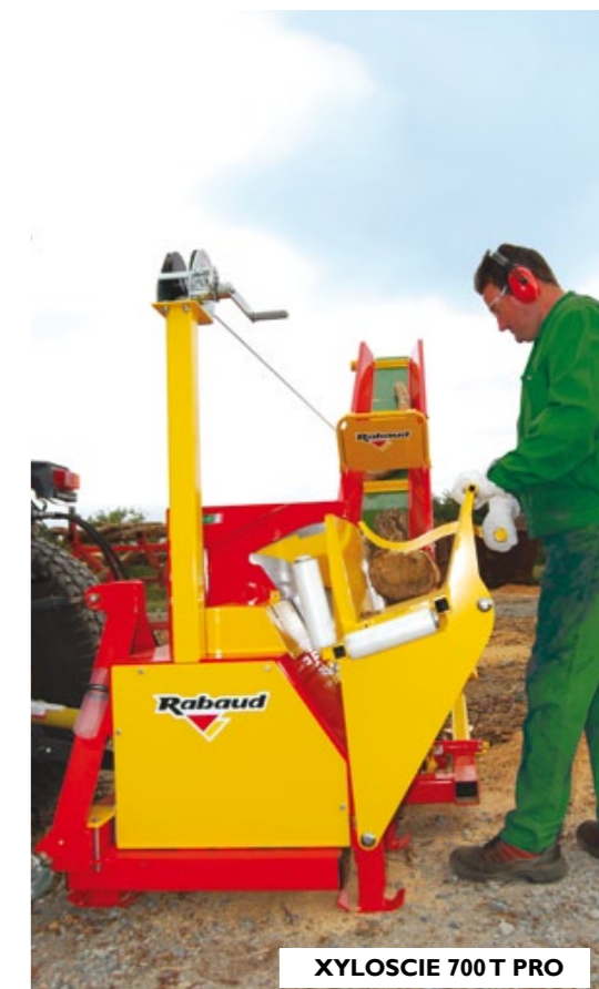
XYLOSCIE 700 T PRO